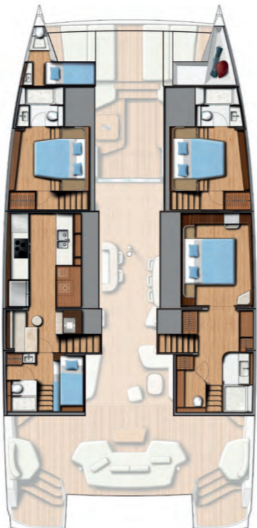
3 DOUBLE CABINS / 3 BATHS (Galley down) Version 3 cabines doubles / 3 sdb (Cuisine en bas)