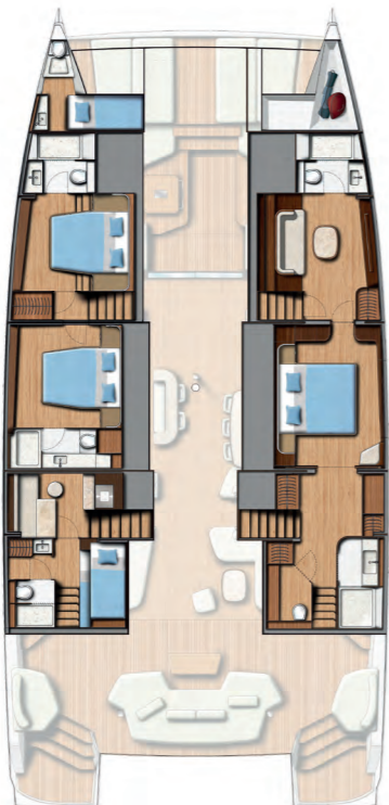
3 DOUBLE CABINS / 3 BATHS (Galley up) Version 3 cabines doubles / 3 sdb (Cuisine en haut)