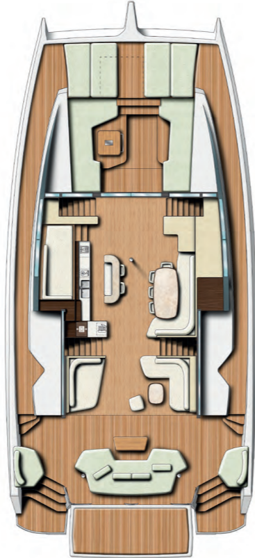
NACELLE with bar Nacelle avec bar