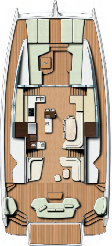
NACELLE with galley Nacelle avec cuisine