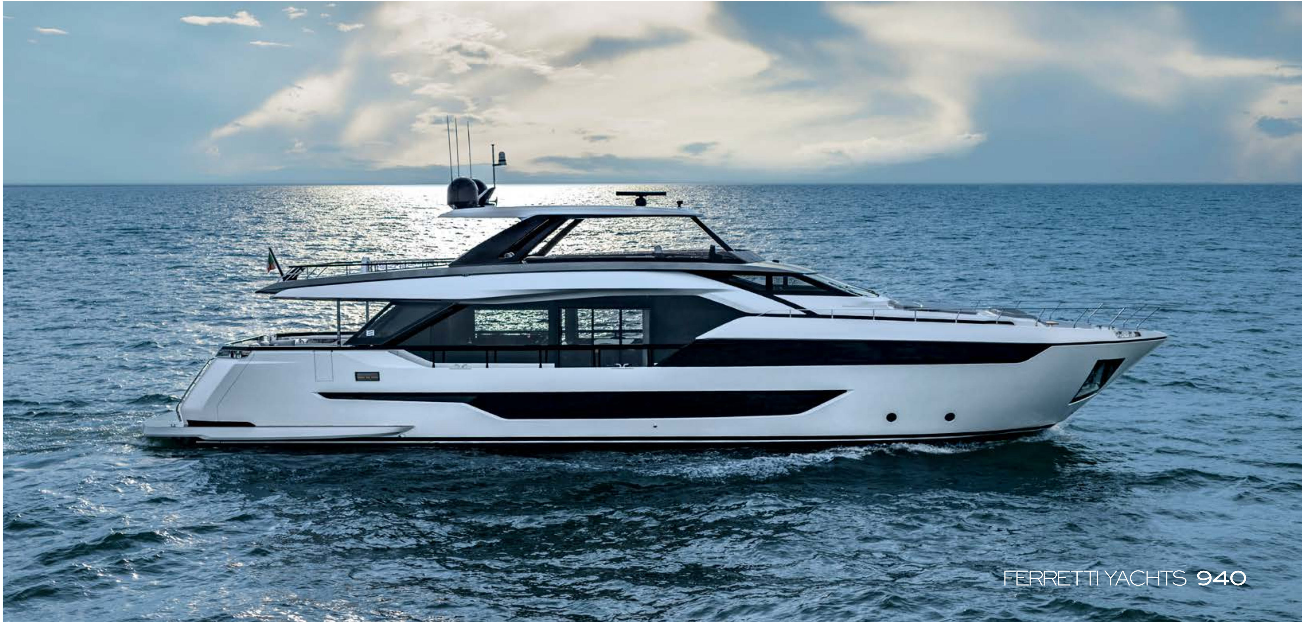
FERRETTI YACHTS 940